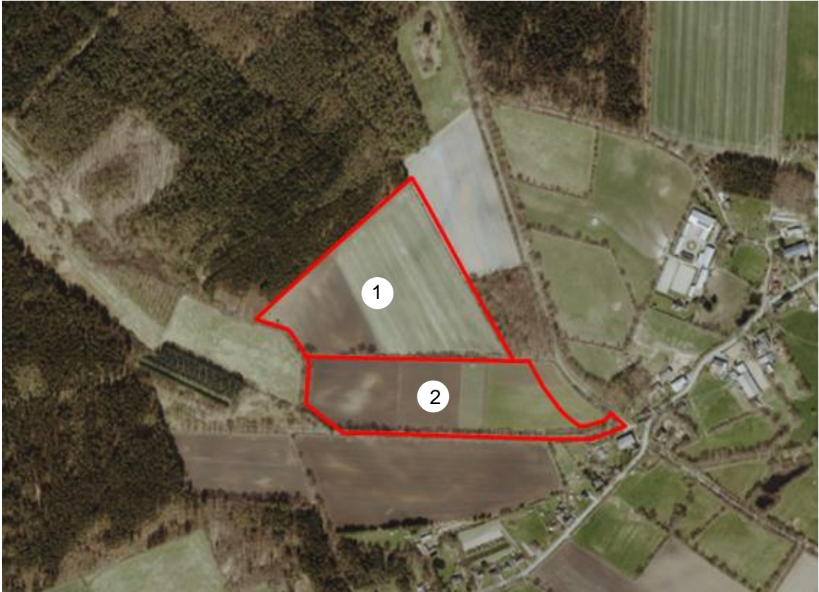
Abb.: Luftbild mit Geltungsbereich, Digitaler Atlas Nord

Das Plangebiet liegt nordwestlich des Siedlungsbereiches von Aasbüttel. Das Vorhabengebiet besteht aus zwei Teilbereichen, welche aktuell landwirtschaftlich genutzt sind.