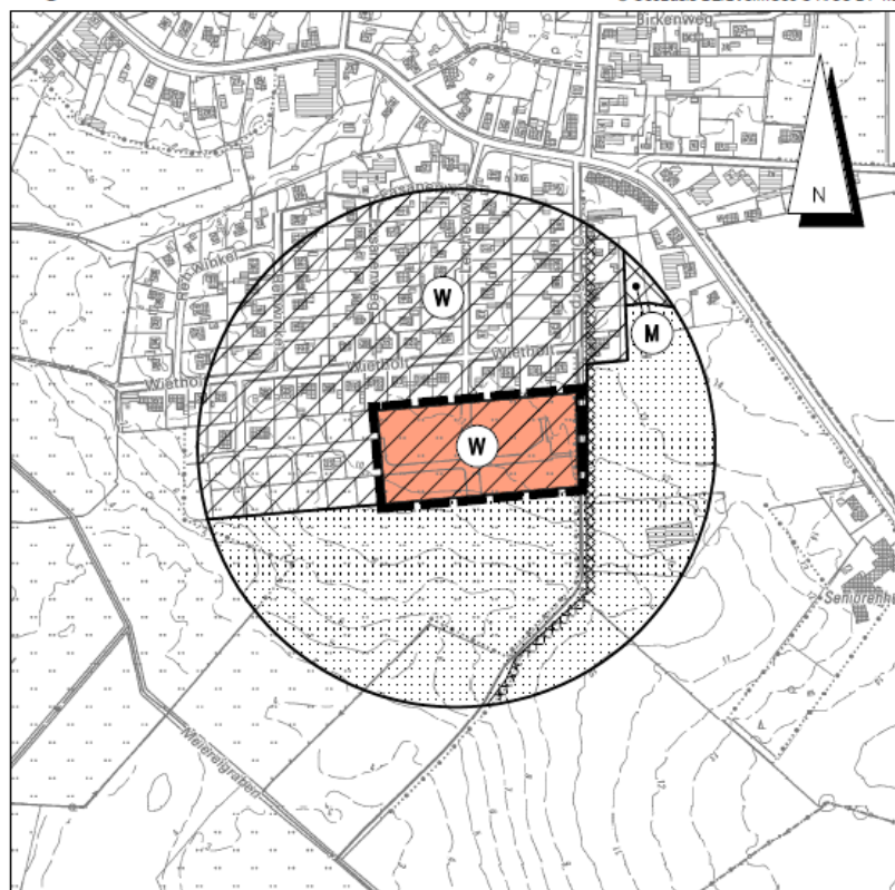
Kreis Steinburg, Gemeinde und Gemarkung Vaale - Flur 7